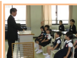
はつしば・帝塚山 体験見学会