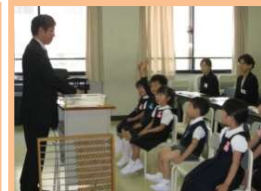
はつしば・帝塚山 体験見学会