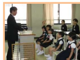
はつしば・帝塚山 体験見学会