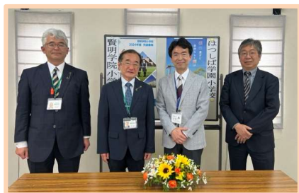
賢明学院 はつしば学園