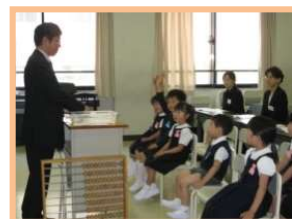
はつしば・帝塚山 体験見学会