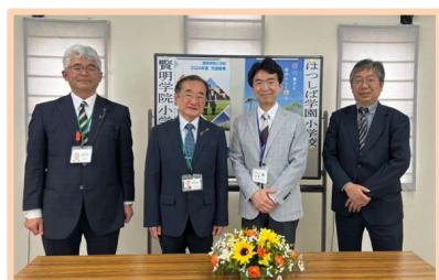
賢明学院 はつしば学園